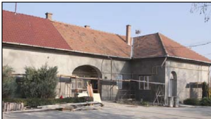
Felújítás alatt a Községháza

Jó ütemben halad a Községháza felújítása és akadálymentesítése, melyet az önkormányzat saját erőből finanszíroz.