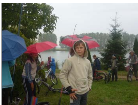
Zuhogó esőben indult a verseny