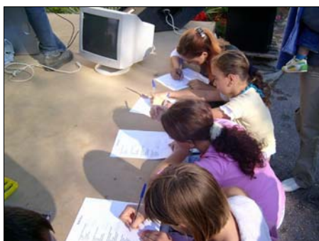
Munkában a gyerekek a szellemi vetélkedőn.

A program szuper discoval zárult, melyen a gyerekek jól buliztak, kiszórakozták magukat, hogy jó kedvűen tudják megkezdeni az új tanévet.