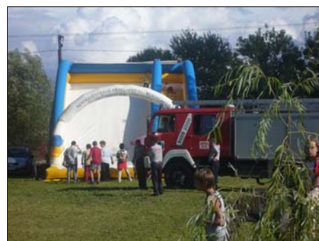
Az ugráló vár egész délután üzemelt.