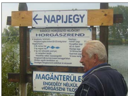
Tibi bácsi a horgász mester nagy izgalommal szemléli a versenyt.