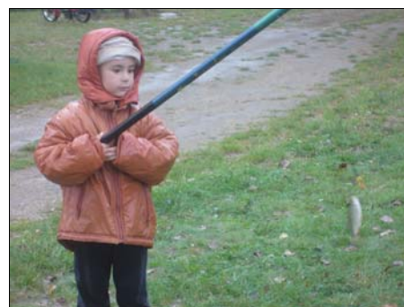
Az első zsákmány