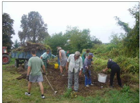
Nagy létszámmal vettek részt a településről.